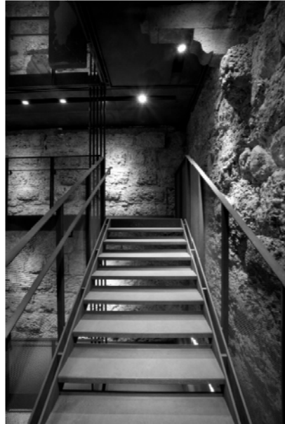
Figura 2 – Particolare della rampa della nuova scala interna