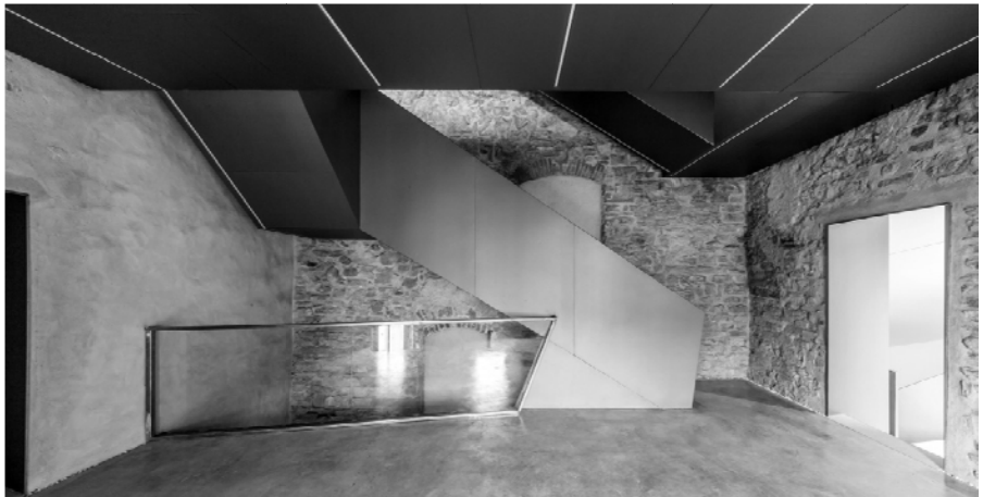
Figura 3 – Vista della nuova scala da piano primo

Il nuovo sistema di risalita, composto da rampe e passerelle, si articola fra i tre corpi di fabbrica, al fine di limitare i tagli della volta al piano terreno. La nuova scala rispetta pienamente la tipologia storica delle scale a rampa unica aperte direttamente sugli ambienti. Tale soluzione non altera né la lettura degli spazi, né tanto meno la fruibilità degli stessi. Inoltre, essendo completamente interna ai volumi, il sistema di risalita non altera la percezione dall'esterno, assicurando la conservazione dell'immagine storica della torre.