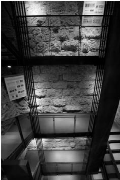
Figura 1 – Sviluppo della nuova scala interna

La ricercata semplicità delle panche e degli elementi architettonici progettati per questo spazio fa da contraltare allo spettacolare panorama che si apre sul territorio circostante e sul sottostante Castello Visconteo, delimitato su tre lati dal corso del fiume Adda. Nel prossimo futuro sono previste manifestazioni musicali, soprattutto serali, che faranno di questa "piccola piazza nel cielo" un luogo suggestivo adatto ai momenti del ristoro non disgiunto dalla cultura.