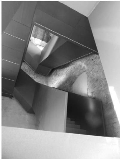
Figura 4 – Sviluppo della nuova scala metallica

Il sistema impiantistico è in gran parte contenuto nello spessore del sotto gradino, garantendo la distribuzione impiantistica ai diversi piani. L'andamento dei controsoffitti è studiato in modo da contenere le unità di trattamento ambiente, i quadri elettrici, i corpi illuminanti e i punti di allaccio con la forza motrice e di connessione alla rete telematica locale ed esterna. Tale scelta progettuale garantisce la conservazione delle murature antiche in pietra, evitando la formazione di tracce.