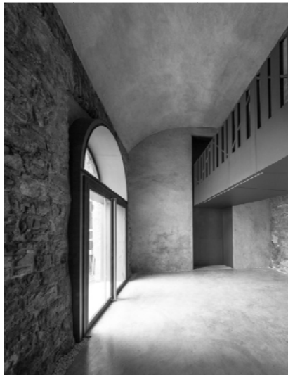
Figura 5 – Passerella posizionata a piano terreno