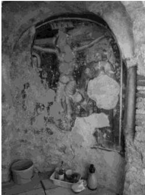
Figura 63 – Affresco della crocifissione durante i lavori di restauro

Prima di intraprendere le operazioni di consolidamento statico, si è proceduto dunque ad una accurata protezione degli affreschi, realizzando una velinatura con carta giapponese e sovrapponendo fogli di polistirolo, distanziati dalle superfici, finalizzati ad attutire eventuali colpi in occasione delle lavorazioni.