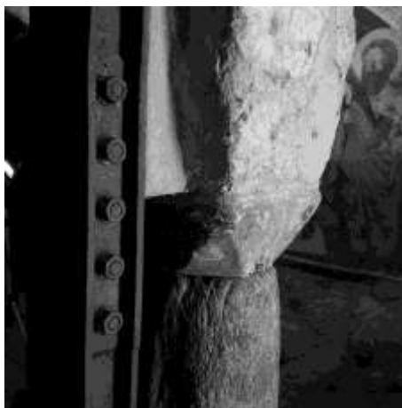
Figura 25 – Dettaglio dell'affiancamento della nuova struttura metallica alla colonnina