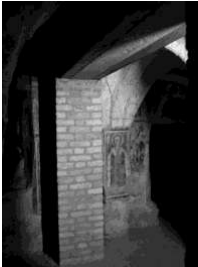
Figura 2 – Sistema di consolidamento inserito negli anni 'trenta

collegano l'arco al soprastante materiale di riempimento, precedentemente iniettato con calce, a rifiuto.