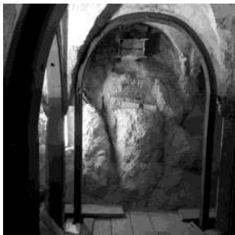
Figura 4 – Gazebo strutturale messo in opera e moncone del presidio strutturale del 1930

La forma dei profili, con due cavità laterali, permette il passaggio di una linea elettrica e l'installazione di punti luce. L'integrazione tra l'approccio architettonico, quello strutturale e quello impiantistico ha permesso di limitare l'invasività delle nuove opere e di dotare l'ambiente di quanto necessario per consentire la fruizione di un luogo che testimonia la Fede al Sacro Monte di Varese, senza mettere a repentaglio la conservazione delle ricchezze che vi sono contenute.