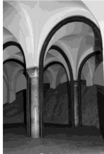
Figura 3 – Modello in scala: studio compositivo del sistema di consolidamento

L'appoggio a terra del "gazebo strutturale" è stato progettato al fine di trasferire il carico direttamente alla roccia sottostante, senza interferire con la fondazione delle colonnine in pietra. In corrispondenza di ciascun montante sono stati previsti alcuni micropali affiancati, in acciaio inox, di lunghezza 70-90 cm, realizzati con tubi valvolati Ø50mm, inghisati nella sottostante roccia integra.